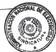
Abog. Javier Otazú Vera Síndico - ANDE