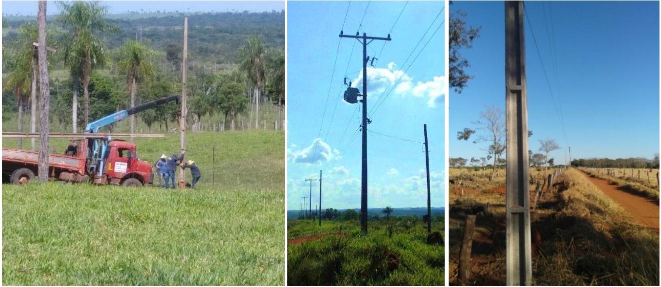
Ejecución de Trabajos de Normalización de Líneas de Autoayuda en MT y BT Canindeyú y San Pedro - Licitación Pública Nacional ANDE N° 1016/2014 - Lotes 1, 2, 3 - BONOS I