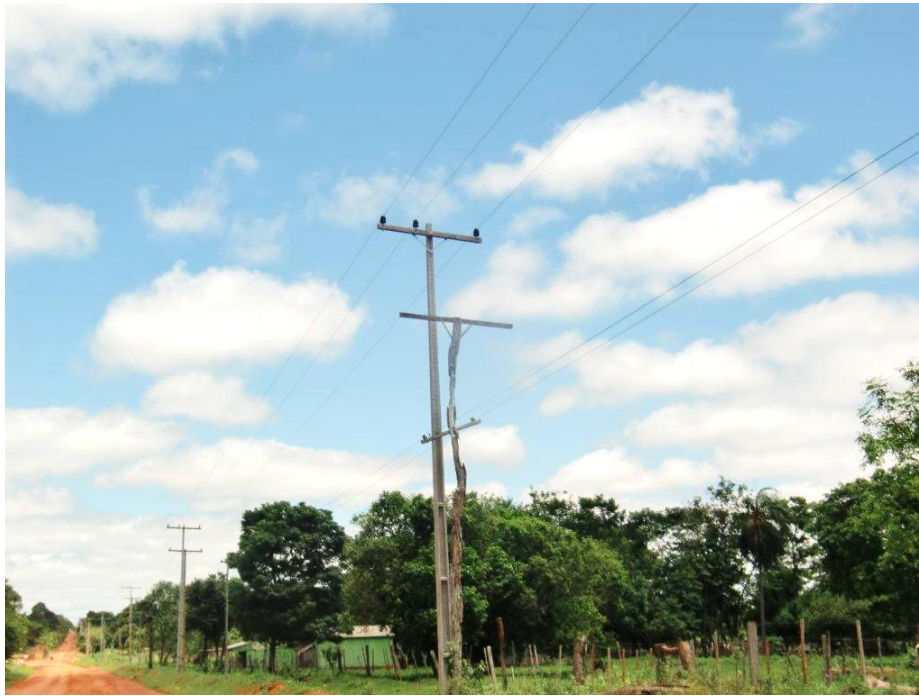
Ejecución de Trabajos de Normalización de Líneas de Autoayuda en MT y BT Canindeyú, Maracaná - Licitación Pública Nacional ANDE N° 969/2014 - BONOS I