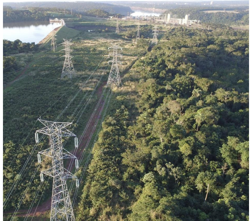
Construcción de la línea de transmisión 2 x 220 kV Acaray - Pte. Franco - Licitación Pública Nacional ANDE N° 1088/2014 - Lote 2 - BONOS II