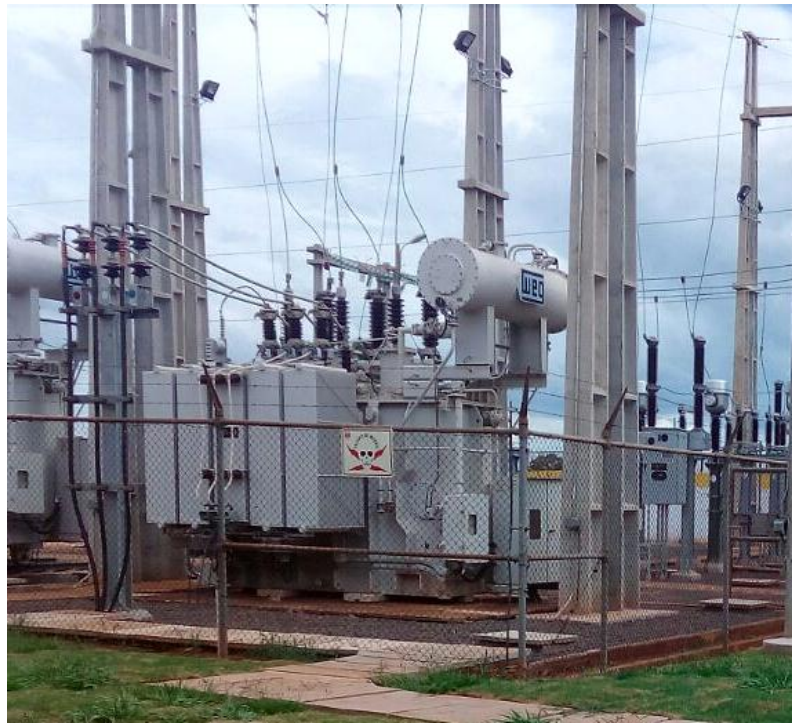
Ampliación de la Subestación PEDRO JUAN CABALLERO Licitación Pública Internacional ANDE N° 914/2013 - Lote 2 - BONOS I