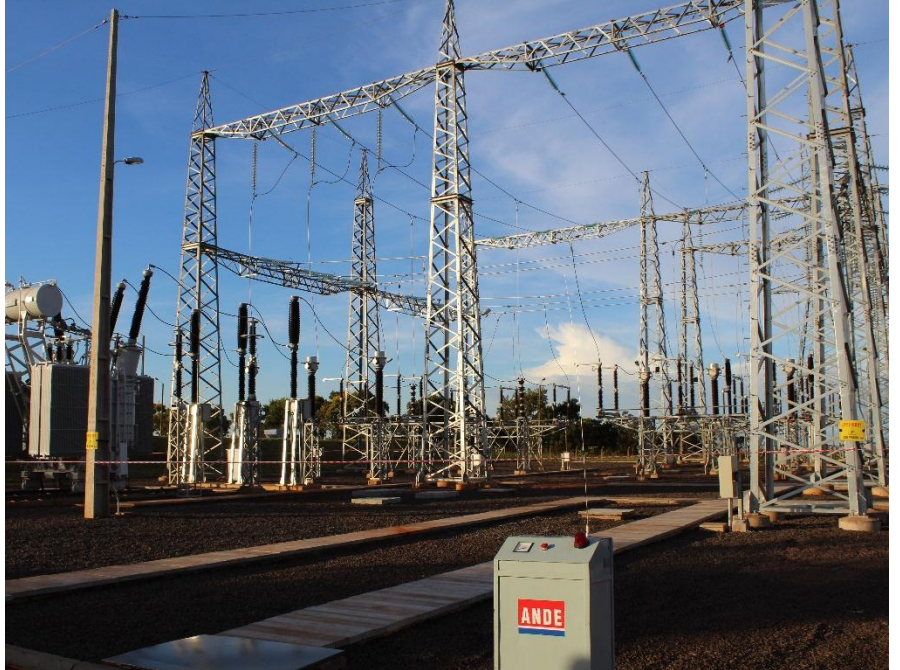
Construcción de la Subestación CERRO CORÁ 220/66/23 kV Licitación Pública Nacional ANDE N° 851/2013 - Lote 6 - BONOS I