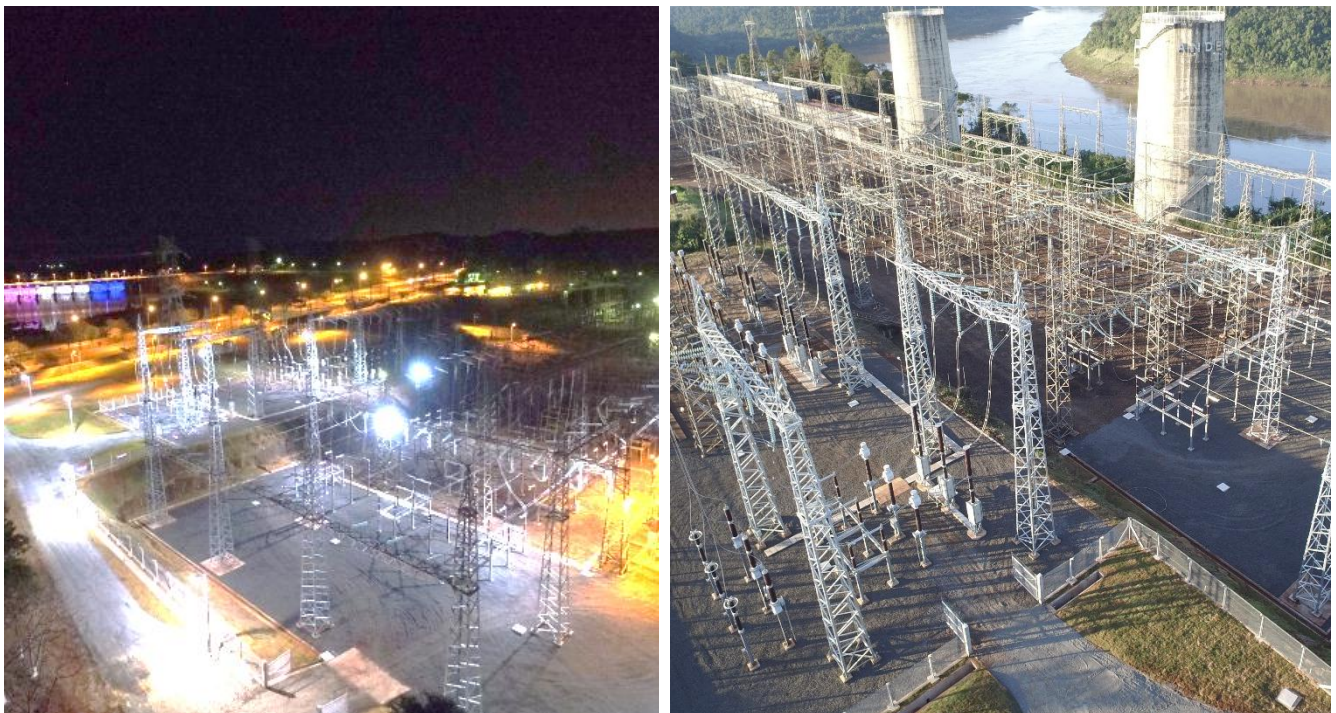
Ampliación de la Subestación Acaray y Pte. Franco Licitación Pública Nacional ANDE N° 1088/2014 - Lote 1 - BONOS II