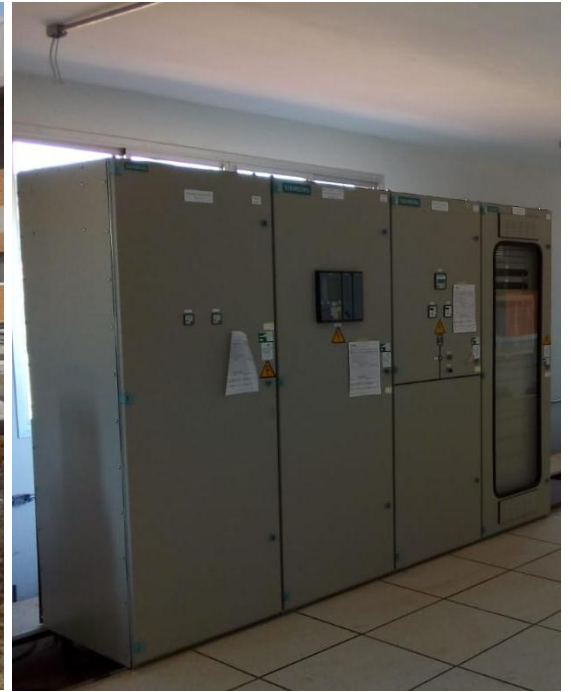
Construcción de la Subestación Barrio Molino en 220/66/23 - Licitación Pública Nacional ANDE N° 1090/2014 - Lote 1 - BONOS II