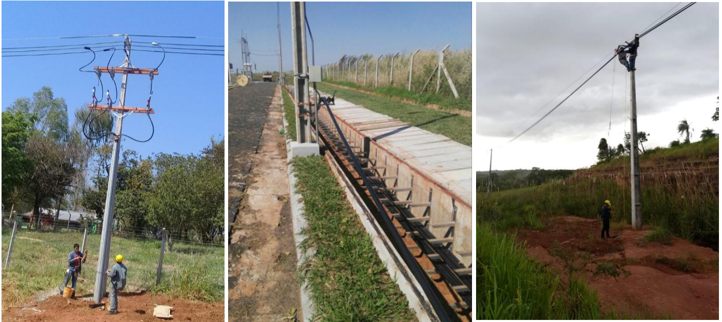
Construcción de Nuevos Alimentadores de Media Tensión emergentes del Centro de Distribución Curuguaty II, en el Distrito de Curuguaty, Departamento de Canindeyú- Licitación Pública Nacional ANDE N° 1221/2016 – BONOS I