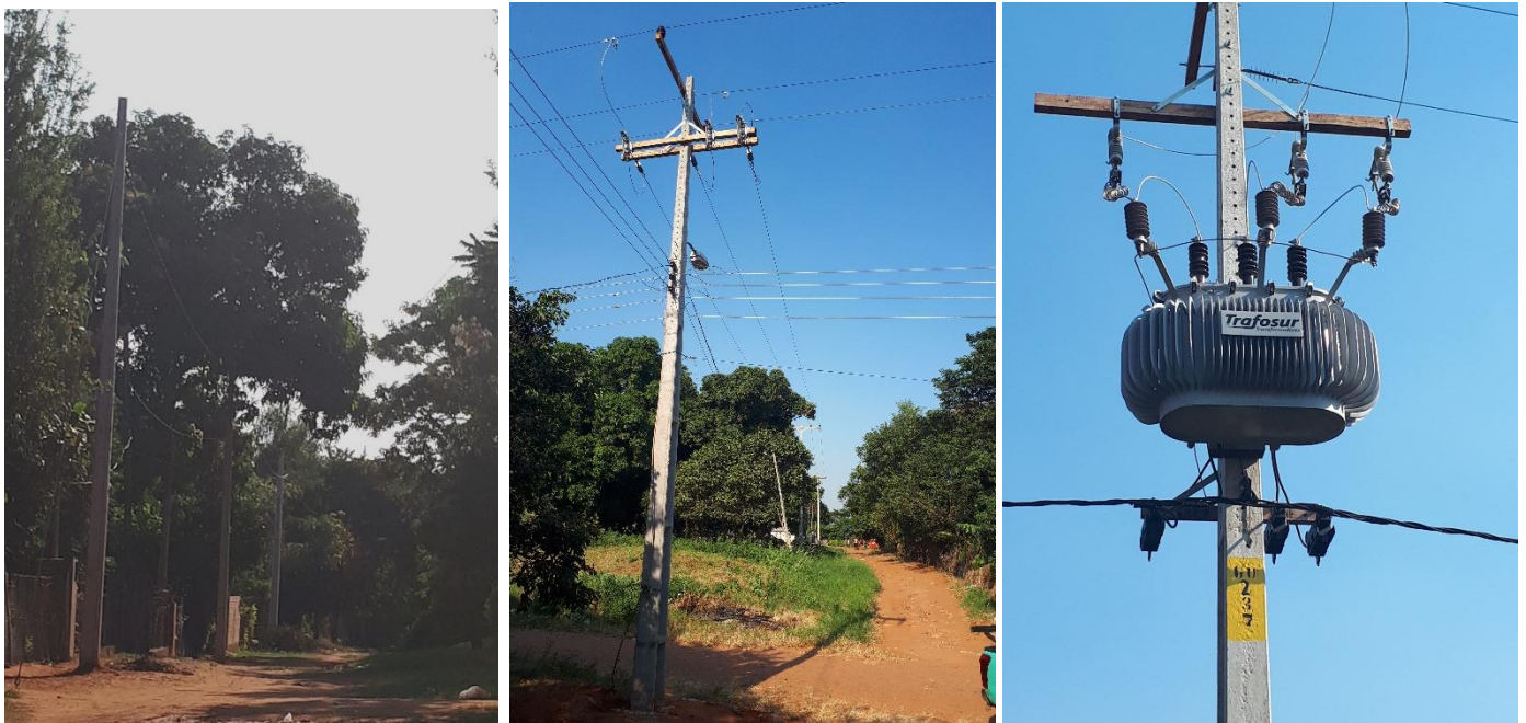
Construcción de Redes de MT, BT y Montaje de PD. Licitación Pública Nacional ANDE N° 1326/2017, Asentamiento San Rafael, Dpto. Central – Lote 4 – BONOS II