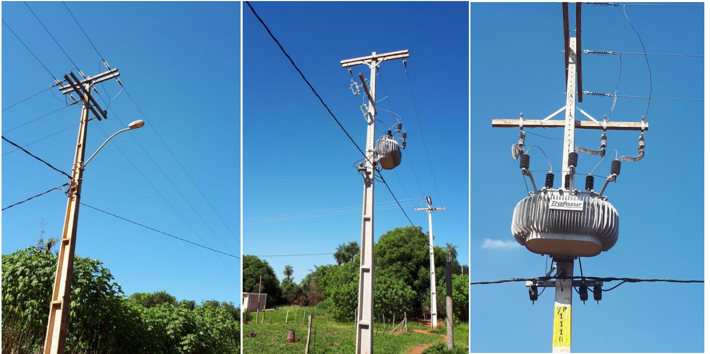
Construcción de Redes de MT, BT y Montaje de PD. Licitación Pública Nacional ANDE N° 1326/2017, Asentamiento Ypane, Dpto. Central – Lote 5 – BONOS II