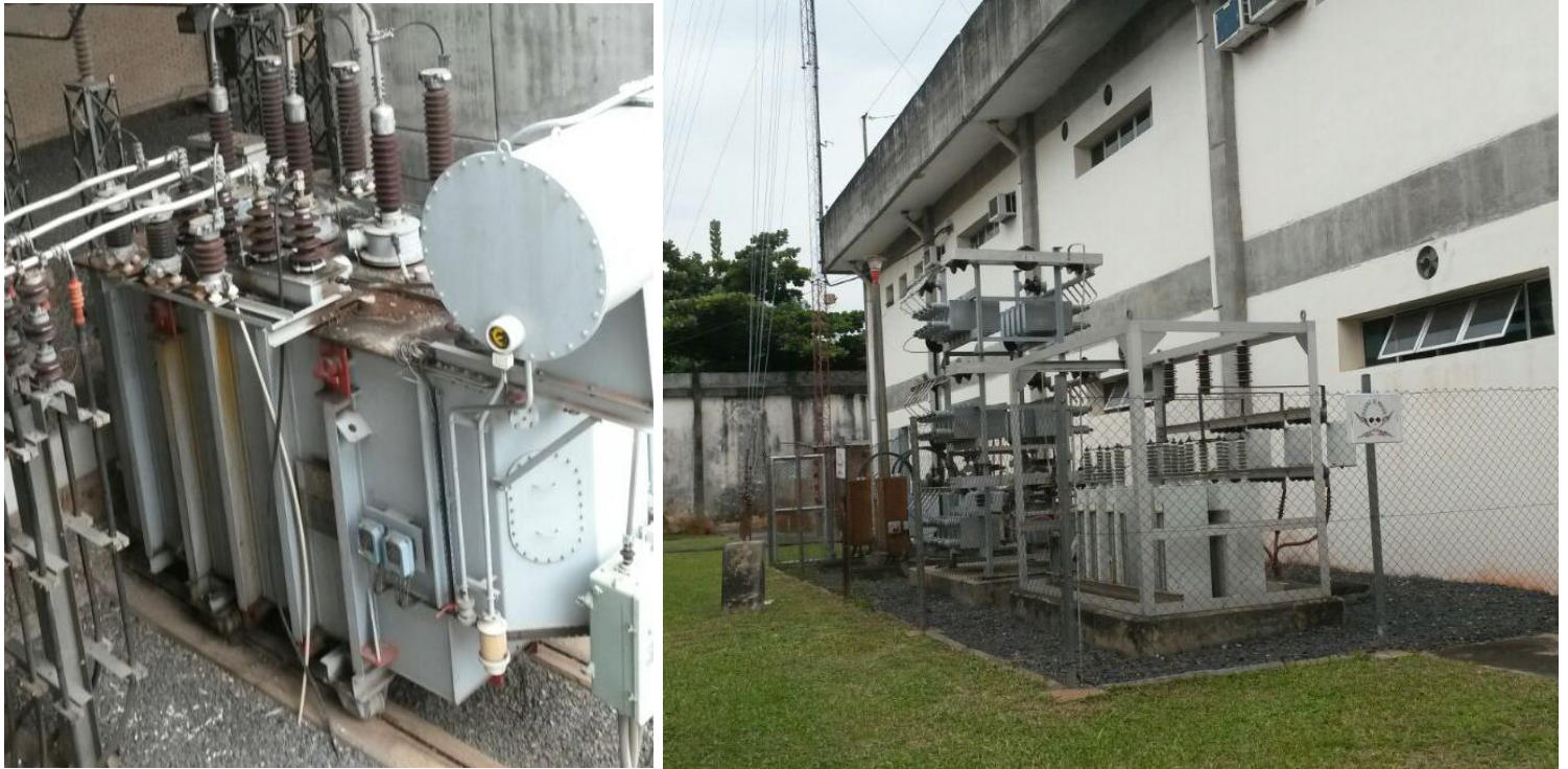
Ampliación de la Subestación GENERAL DIAZ Licitación Pública Internacional ANDE N° 914/2013 - Lote 7 - BONOS I