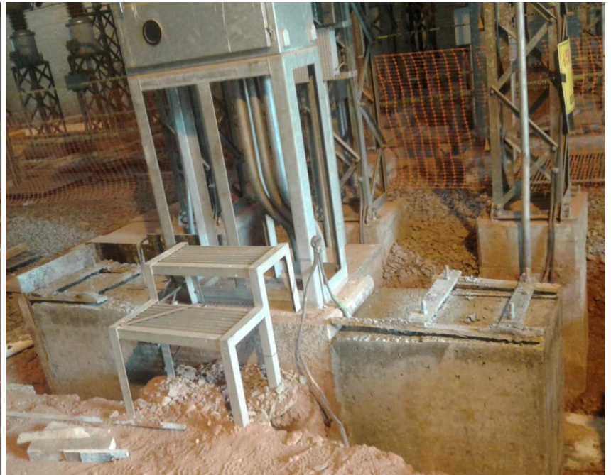
Construcción e Interconexión de la Subestación Villa Aurelia en 220 kV - Licitación Pública Nacional ANDE N° 1089/2014 - Lote 1 - BONOS II