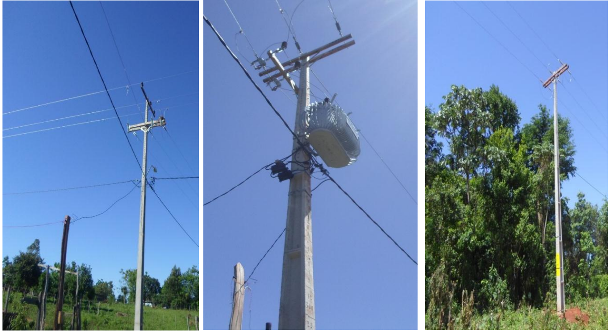
Ampliación de Línea de MT y BT, Montaje de Puesto de Distribución para el Asentamiento Ñu Pyahu, Distrito de Tavaí, Dpto. de Caazapá - Licitación Pública Nacional ANDE N° 1194/2016 - BONOS I