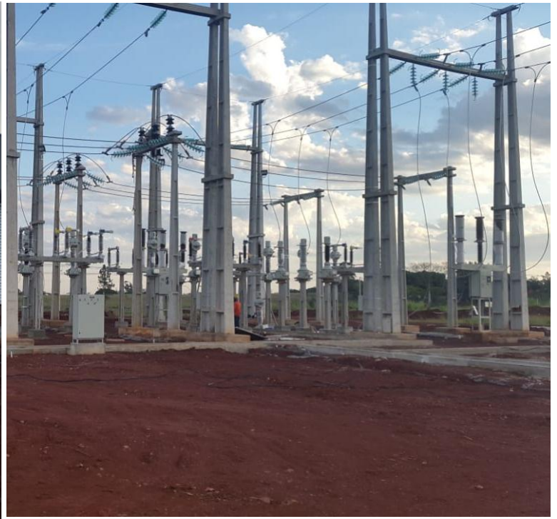
Construcción e Interconexión de la Subestación Fram 66 kV - Licitación Pública Nacional ANDE N° 1200/2016 - Lote 1 - BONOS II