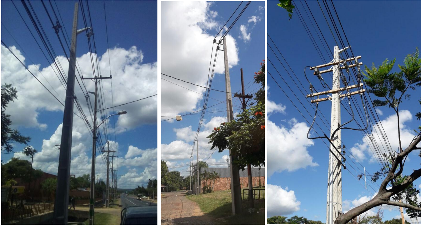
Construcción de nuevo alimentador de MT ITG 08 desde el Centro de Distribución Itauguá. Licitación Pública Nacional ANDE N° 1312/2017 – BONOS II