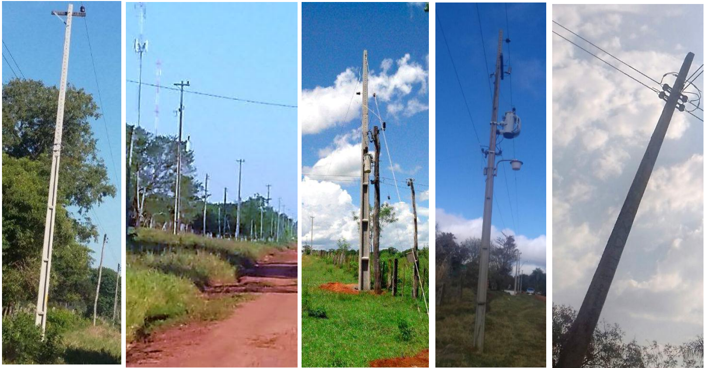
Ejecución de Trabajos de Normalización de Líneas de Autoayuda en MT y BT Licitación Pública Nacional ANDE N° 992/2014 – Lotes 1, 2, 3, 4 y 5 - BONOS I