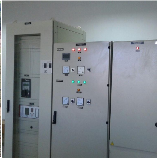
Construcción de la Subestación CURUGUATY 220/23 kV Licitación Pública Nacional ANDE N° 851/2013 - Lote 5 - BONOS I