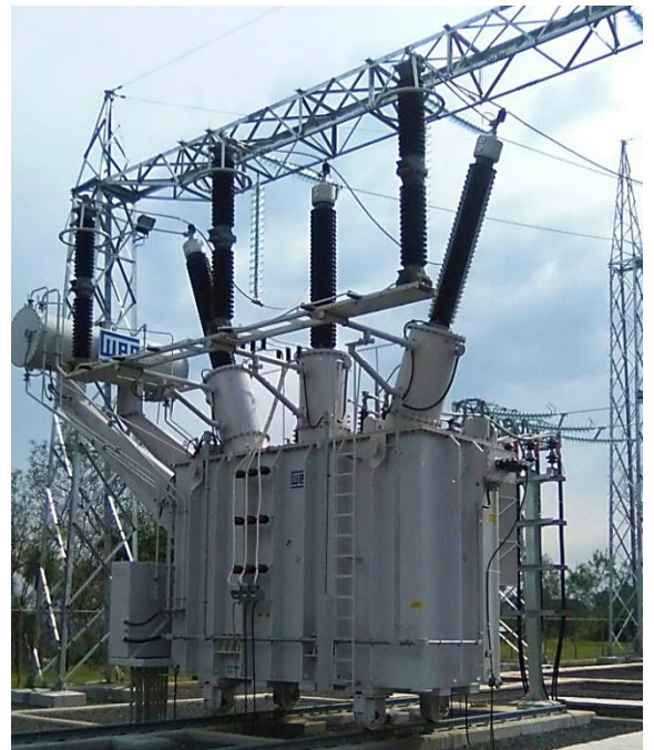
Ampliación de la Subestación SAN ESTANISLAO Licitación Pública Internacional ANDE N° 914/2013 - Lote 3 - BONOS I