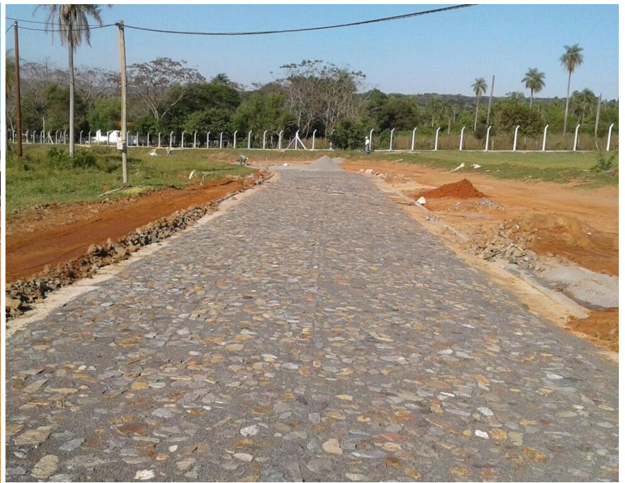
Construcción e Interconexión de la Subestación Altos en 220 kV, Licitación Pública Nacional ANDE N° 1203/2016 - Lote 1 - BONOS II