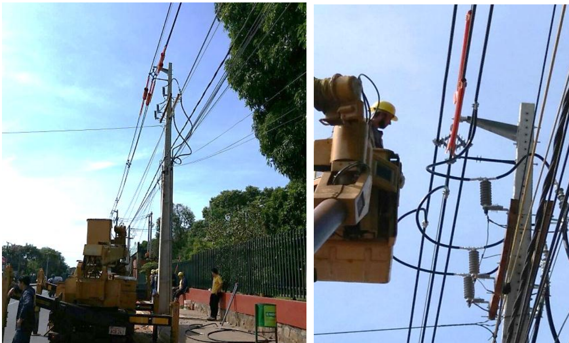
Construcción de Nuevos Alimentadores de Media Tensión emergentes del Futuro Centro de Distribución Fernando de la Mora, Distritos de Fdo. de la Mora y Asunción- Licitación Pública Nacional ANDE N° 1222/2016 – BONOS I