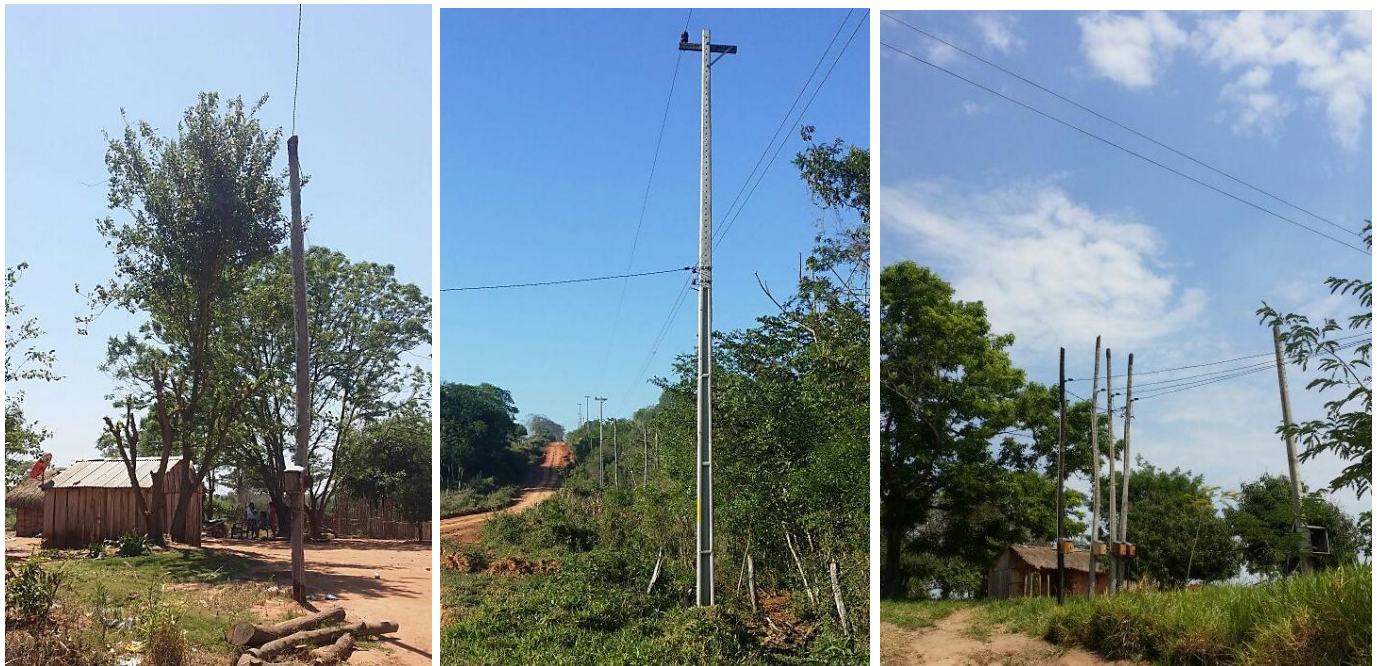
Ejecución de Trabajos de Normalización de Líneas de Autoayuda en MT y BT Canindeyú - Licitación Pública Nacional ANDE N° 1008/2014 – BONOS I