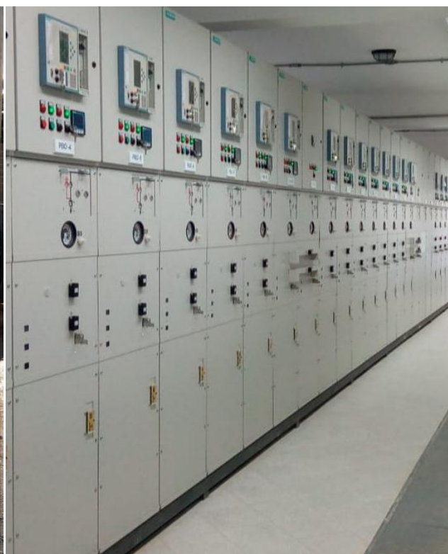
Ampliación de la Subestación PUERTO BOTÁNICO Licitación Pública Internacional ANDE N° 914/2013 - Lote 6 - BONOS I