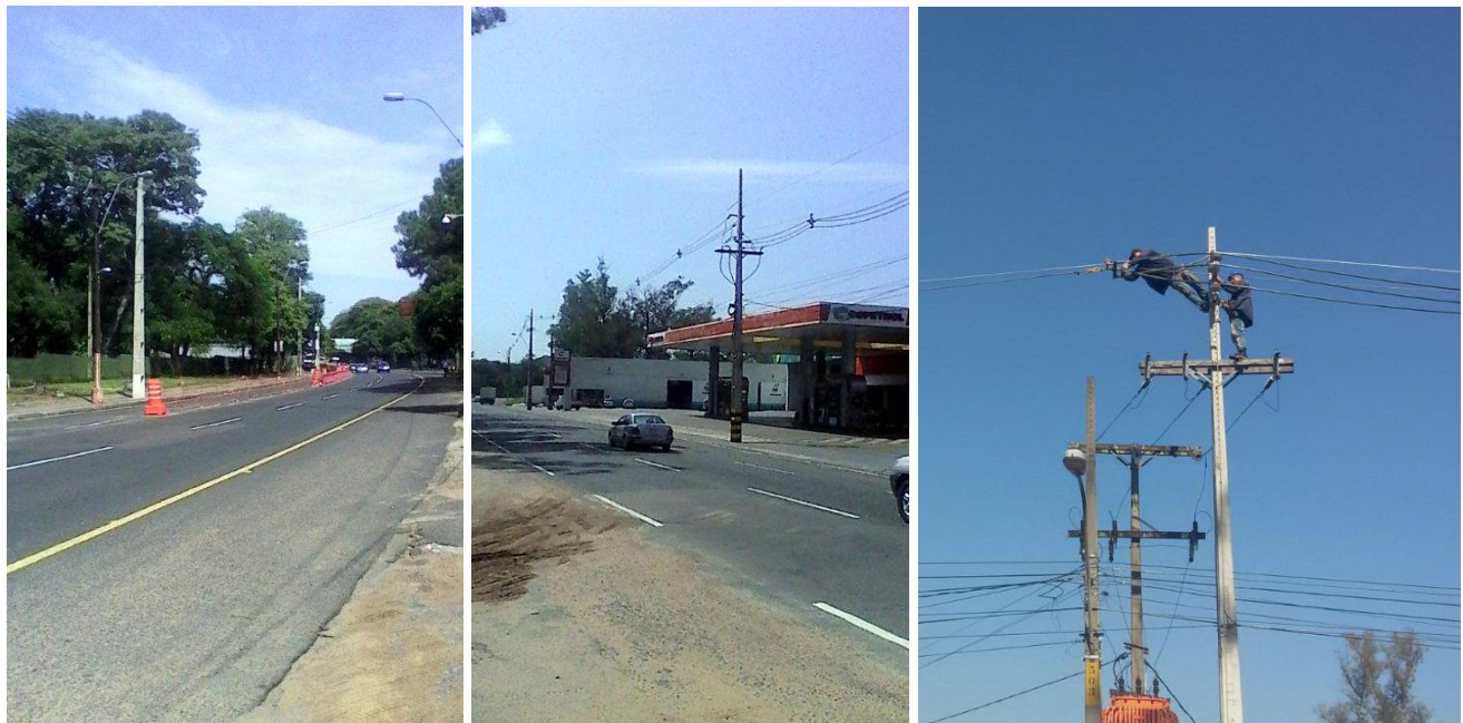
Adecuación de red de MT y BT a Protegida y Preensamblada en los Alimentadores de los Centros de Distribución San Lorenzo, La Victoria y Capiatá, en Distritos de San Lorenzo, Capiatá y Areguá, en el Dpto. Central- Licitación Pública Nacional ANDE N° 1036/2014 - Lotes 1 y 4 - BONOS I