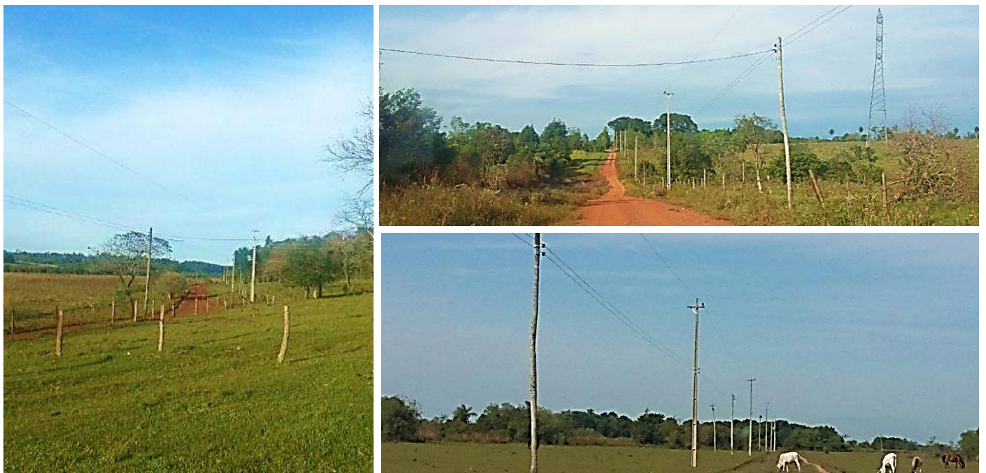
Ejecución de Trabajos de Normalización de Líneas de Autoayuda de BT y MT Licitación Pública Nacional ANDE N° 991/2014 - Lotes 3 y 6 - BONOS I