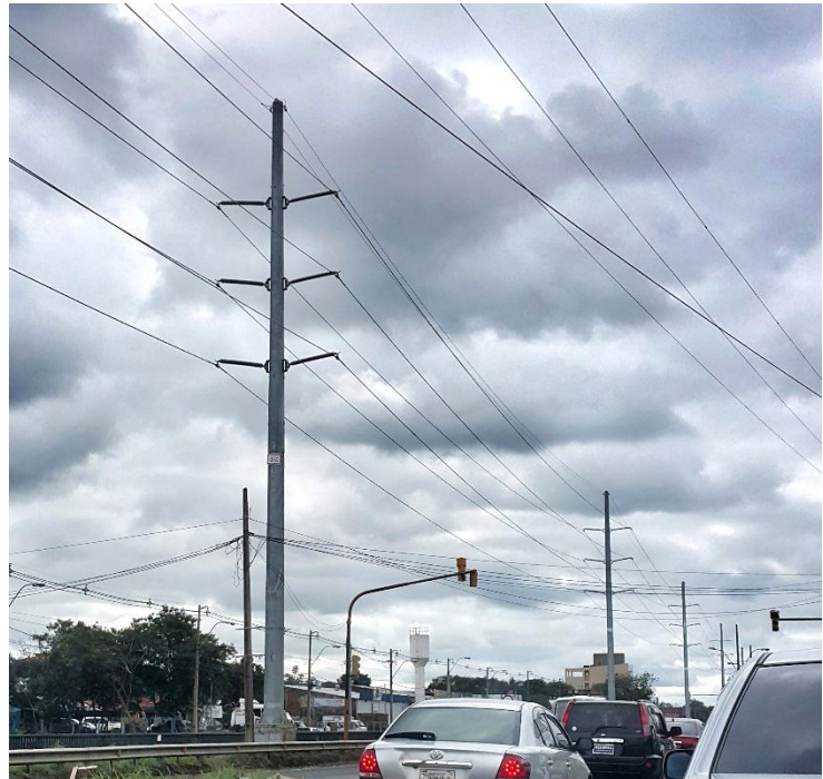
Construcción de la Línea de Transmisión de 220 kV entre las Subestaciones Puerto Botánico y Barrio Molino - Licitación Pública Nacional ANDE N° 1090/2014 - Lote 2 - BONOS II