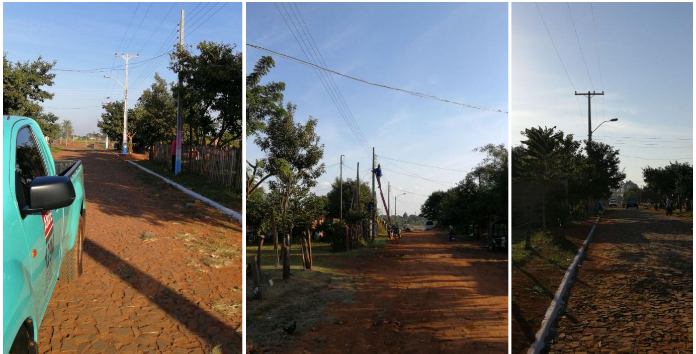
Construcción de Redes de MT, BT y Montaje de PD. Licitación por Concurso de Ofertas N° 956/2017, Distritos de Minga Guazú y Hernandarias, Dpto. Alto Paraná – Lotes 1 y 2 – BONOS II