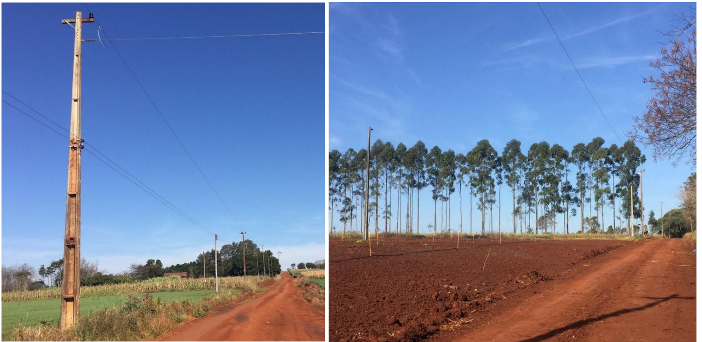
Ejecución de trabajos de normalización de líneas de autoayuda en MT y BT, en el Dpto. de Itapúa, Distrito de Tomas Romero Pereira - Licitación Pública Nacional ANDE N° 1196/2016 - BONOS I