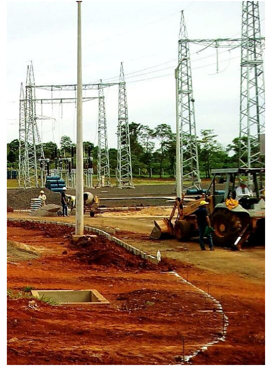
Construcción de la Subestación CAPITÁN BADO 220/23 KV - Licitación Pública Nacional ANDE N° 851/2013 - Lote 4 - BONOS I