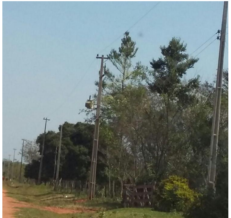
Ejecución de Trabajos de Normalización de Líneas de Autoayuda de BT y MT Licitación Pública Nacional ANDE N° 990/2014 - Lotes 1, 2 y 3 - BONOS I