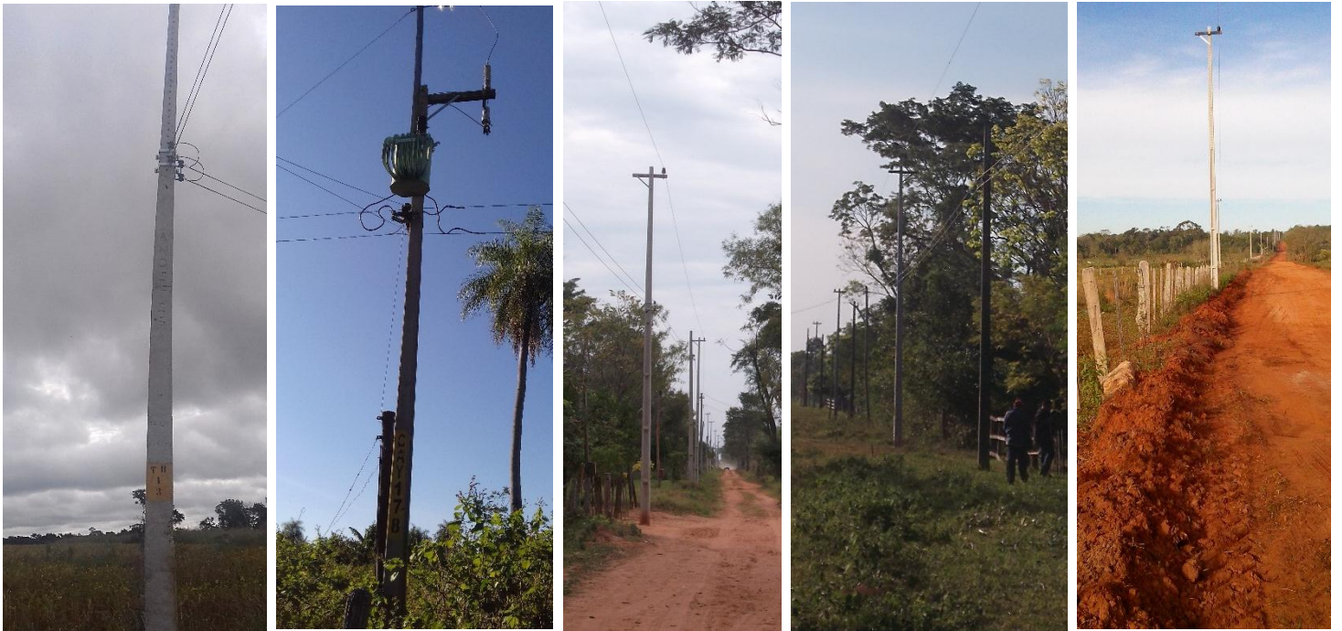
Ejecución de Trabajos de Normalización de Líneas de Autoayuda de BT y MT Licitación Pública Nacional ANDE N° 990/2014 - Lotes 4, 5, 6, 7 y 8 - BONOS I