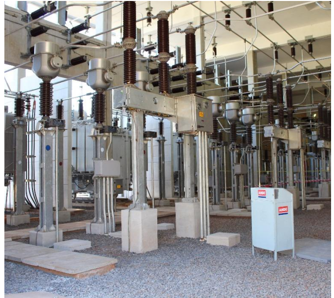
Construcción de la Subestación FERNANDO DE LA MORA y Ampliación de la Subestación SAN LORENZO - Licitación Pública Nacional ANDE N° 852/2013 - Lote 1 - BONOS I