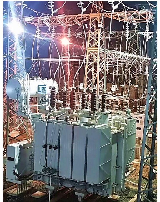
Ampliación de la Subestación HERNANDARIAS Licitación Pública Internacional ANDE N° 914/2013 - Lote 4 - BONOS I