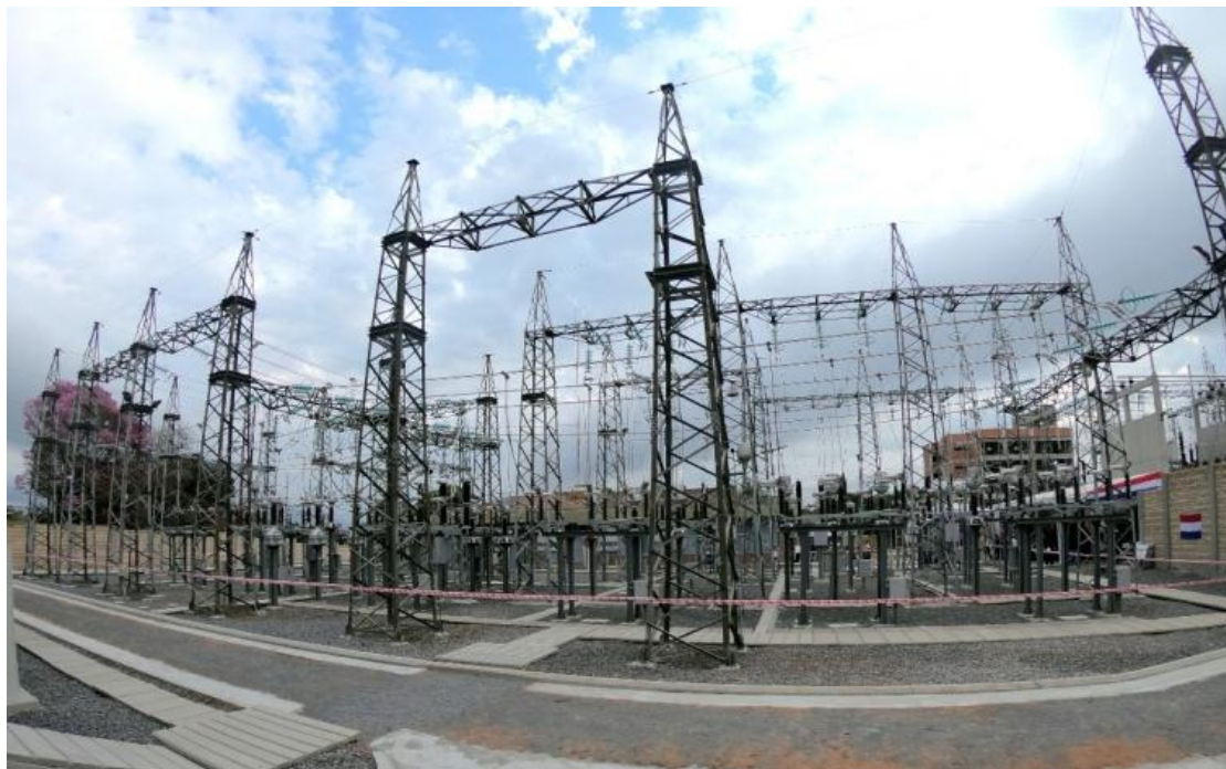
Ampliación de la Subestación LAMBARÉ Licitación Pública Internacional ANDE N° 914/2013 - Lote 5 - BONOS I