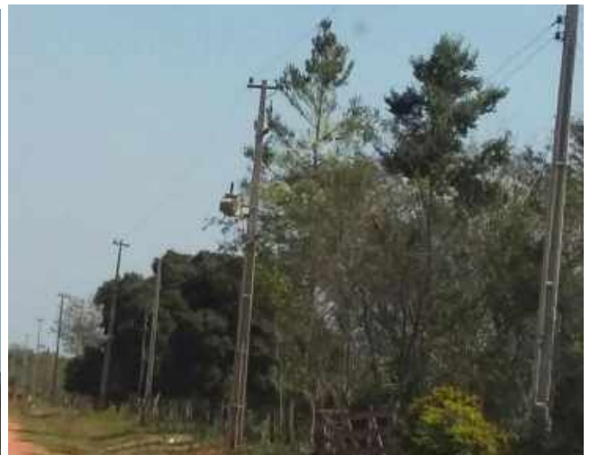
Ejecución de Trabajos de Normalización de Líneas de Autoayuda de BT y MT Licitación Pública Nacional ANDE N° 990/2014 - Lotes 1, 2 y 3 - BONOS I