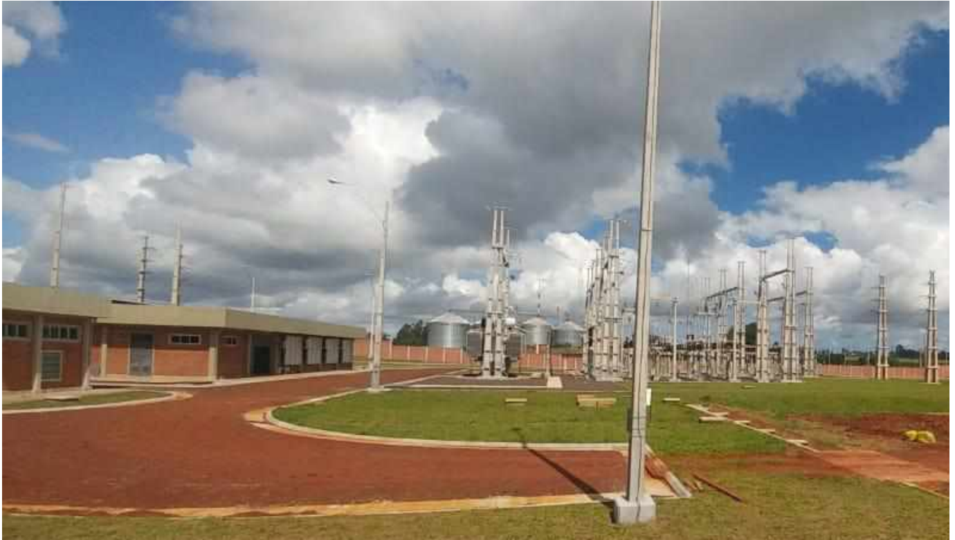
Construcción e Interconexión de la Subestación Fram 66 kV - Licitación Pública Nacional ANDE N° 1200/2016 - Lote 1 - BONOS II