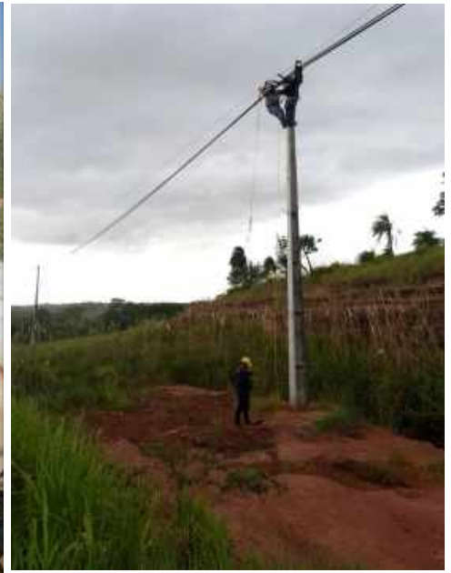
Construcción de Nuevos Alimentadores de Media Tensión emergentes del Centro de Distribución Curuguay II, en el Distrito de Curuguay, Departamento de Canindeyú- Licitación Pública Nacional ANDE N° 1221/2016 – BONOS I