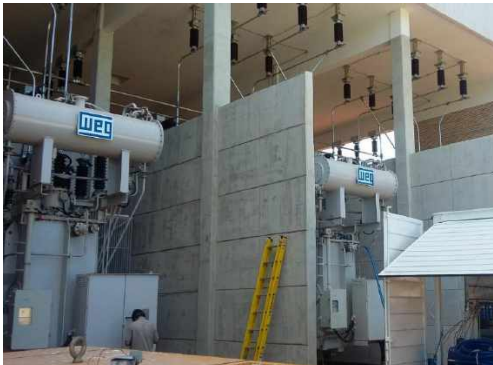
Construcción de la LT 66 kV subterránea SAN LORENZO - FDO. DE LA MORA - Licitación Pública Nacional ANDE N° 852/2013 - Lote 2 - BONOS I