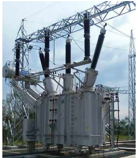
Ampliación de la Subestación SAN ESTANISLAO Licitación Pública Internacional ANDE N° 914/2013 - Lote 3 - BONOS I