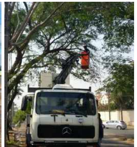
Adecuación de Red de MT y BT a Protegida y Preensamblada en Distritos de Asunción y Dpto. Central- Licitación Pública Nacional ANDE N° 1094/2015 – Lotes 1, 2 y 4 - BONOS I