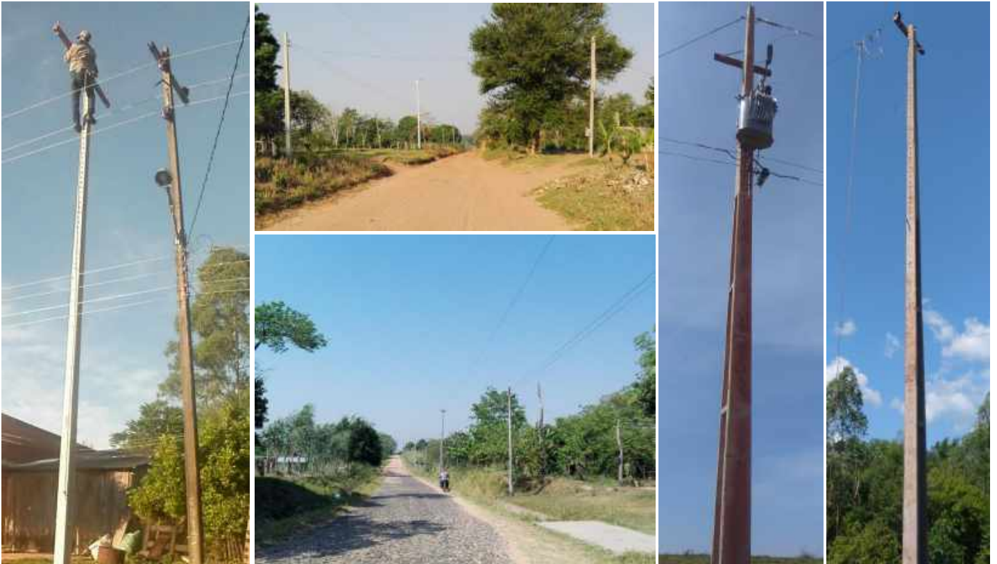
Ejecución de Trabajos de Normalización de Líneas de Autoayuda en MT y BT Canindeyú y San Pedro - Licitación Pública Nacional ANDE N° 1016/2014 - Lotes 1, 2, 3 - BONOS I