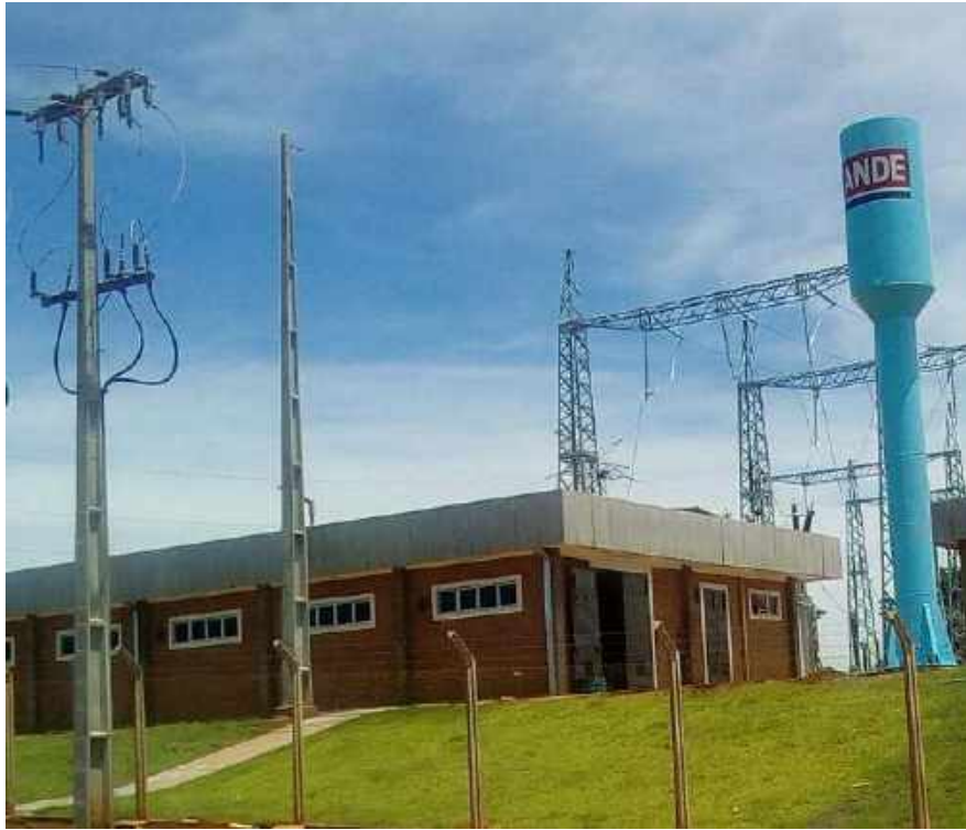
Construcción de la Subestación CAPITÁN BADO 220/23 KV - Licitación Pública Nacional ANDE N° 851/2013 - Lote 4 - BONOS I