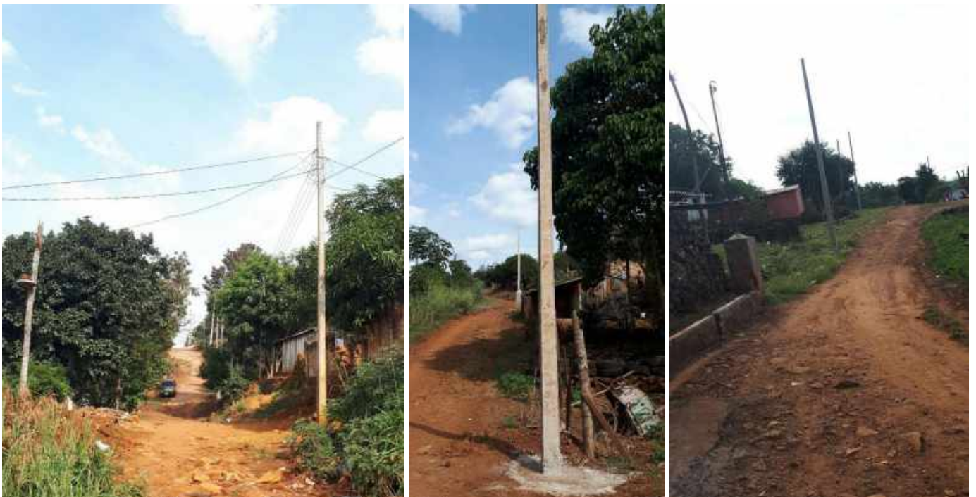
Construcción de Redes de MT, BT y Montaje de PD. Licitación por Concurso de Ofertas N° 956/2017, Asentamiento de Mcal. López-km4, del Distrito de Ciudad del Este – Lote 3 – BONOS II