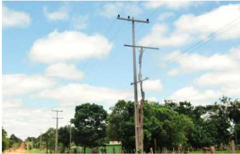
Ejecución de Trabajos de Normalización de Líneas de Autoayuda en MT y BT Canindeyú, Maracaná - Licitación Pública Nacional ANDE N° 969/2014 - BONOS I