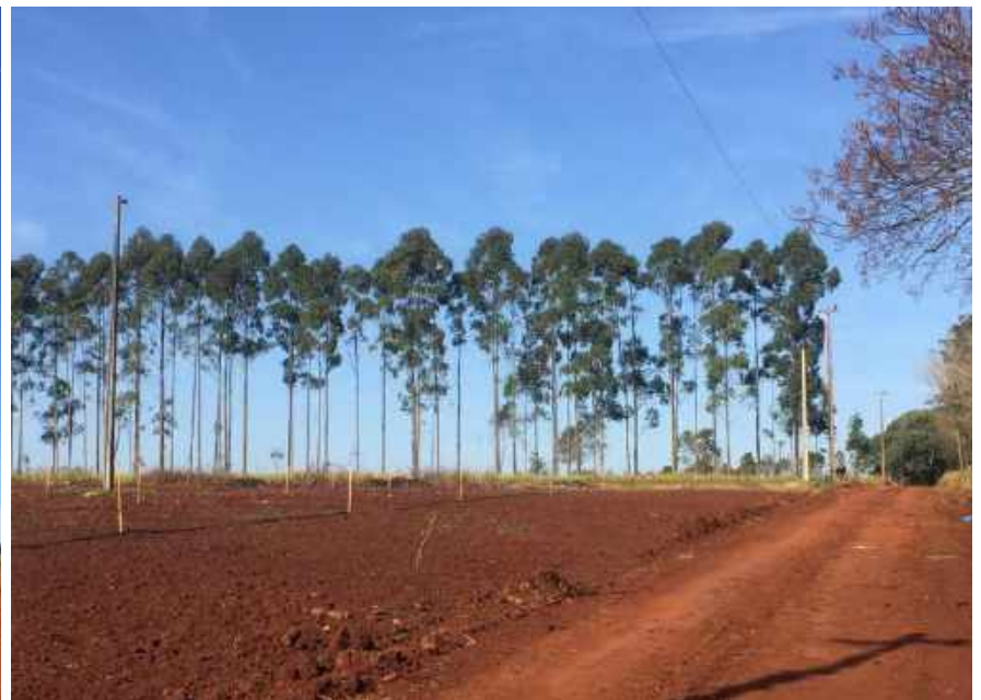
Ejecución de trabajos de normalización de líneas de autoayuda en MT y BT, en el Dpto. de Itapúa, Distrito de Tomas Romero Pereira - Licitación Pública Nacional ANDE N° 1196/2016 - BONOS I