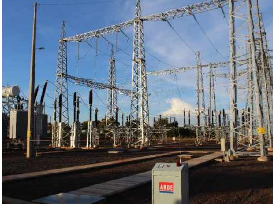
Construcción de la Subestación CERRO CORÁ 220/66/23 kV Licitación Pública Nacional ANDE N° 851/2013 - Lote 6 - BONOS I