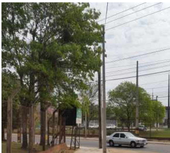
Construcción de Nuevas Líneas de MT PBO 02-05, para alimentación de viviendas sociales en el RC4, en las Ciudades de Asunción y Mariano Roque Alonso, Distrito Capital y Dpto. Central - Licitación Pública Nacional ANDE N° 1168/2015 – Bonos II