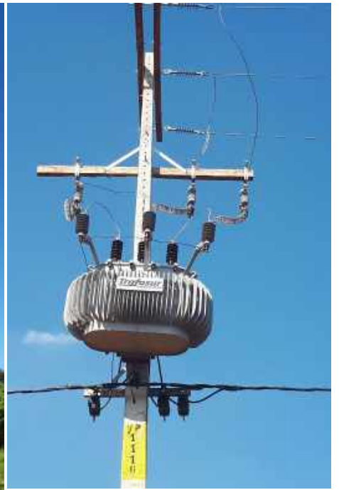
Construcción de Redes de MT, BT y Montaje de PD. Licitación Pública Nacional ANDE N° 1326/2017, Asentamiento Ypane, Dpto. Central – Lote 5 – BONOS II