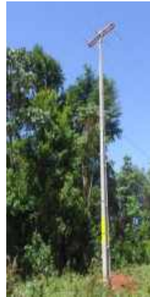
Ampliación de Línea de MT y BT, Montaje de Puesto de Distribución para el Asentamiento Ñu Pyahu, Distrito de Tavaí, Dpto. de Caazapá - Licitación Pública Nacional ANDE N° 1194/2016 - BONOS I