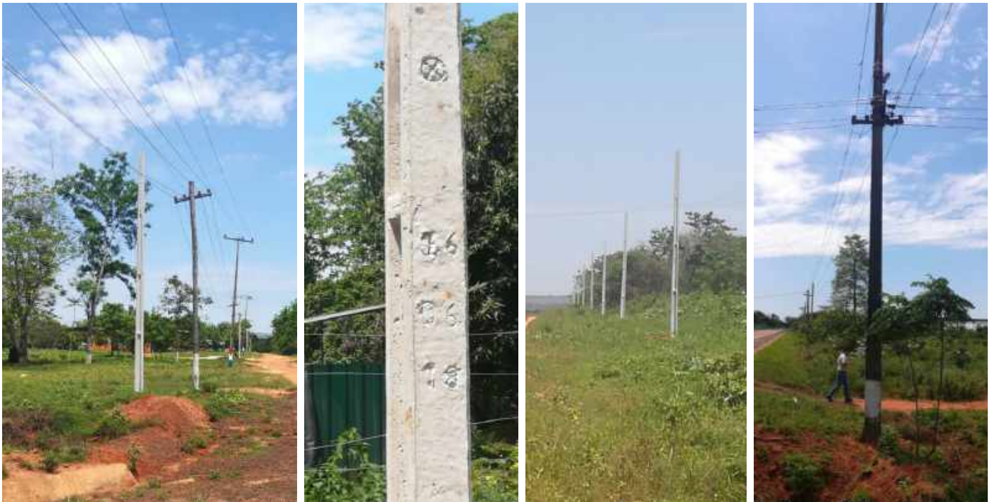
Construcción de Redes de MT, BT y Montaje de PD. Licitación Pública Nacional ANDE N° 1321/2017, Asent. Tava Guaraní, Distrito de Santa Rosa del Aguaray. Dpto. de San Pedro. Lote 2 – Bonos II