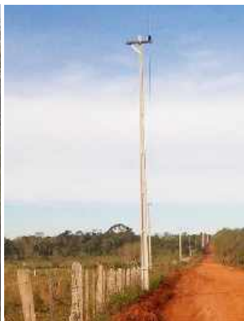
Ejecución de Trabajos de Normalización de Líneas de Autoayuda de BT y MT Licitación Pública Nacional ANDE N° 990/2014 - Lotes 4, 5, 6, 7 y 8 - BONOS I