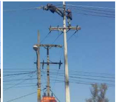
Adecuación de red de MT y BT a Protegida y Preensamblada en los Alimentadores de los Centros de Distribución San Lorenzo, La Victoria y Capiatá, en el Dpto. Central Licitación Pública Nacional ANDE N° 1036/2014 – Lotes 1 y 4 - BONOS I