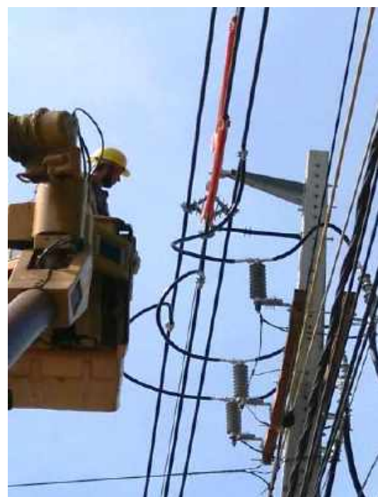
Construcción de Nuevos Alimentadores de Media Tensión emergentes del Futuro Centro de Distribución Fernando de la Mora, Distritos de Fdo. de la Mora y Asunción- Licitación Pública Nacional ANDE N° 1222/2016 – BONOS I