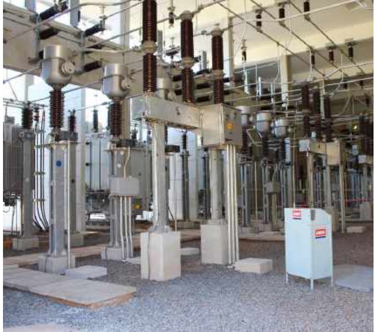
Construcción de la Subestación FERNANDO DE LA MORA y Ampliación de la Subestación SAN LORENZO - Licitación Pública Nacional ANDE N° 852/2013 - Lote 1 - BONOS I