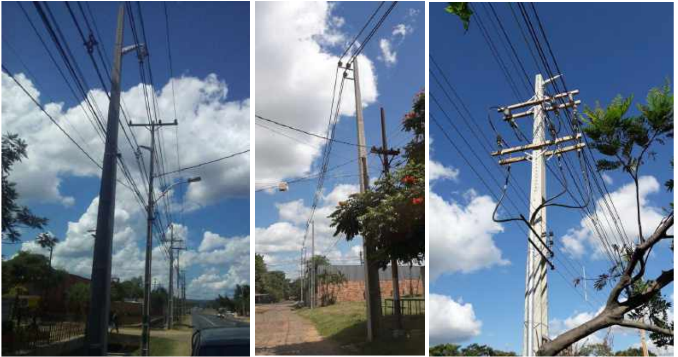
Construcción de nuevo alimentador de MT ITG 08 desde el Centro de Distribución Itauguá. Licitación Pública Nacional ANDE N° 1312/2017 – BONOS II