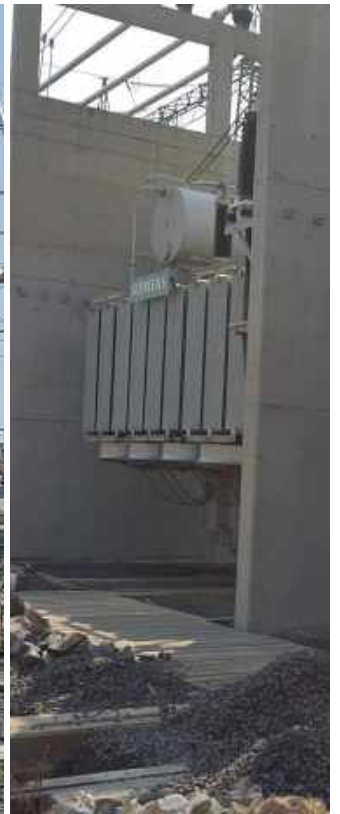
Ampliación de la Subestación PUERTO BOTÁNICO Licitación Pública Internacional ANDE N° 914/2013 - Lote 6 - BONOS I