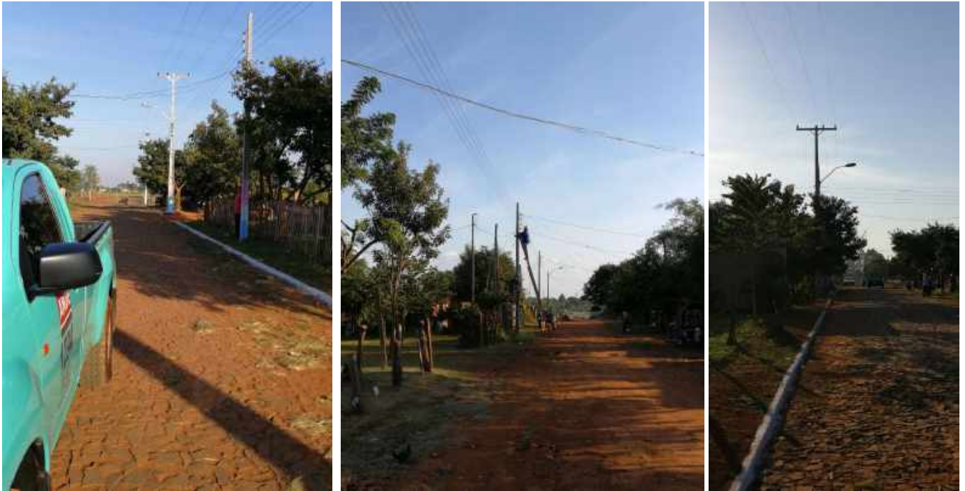
Construcción de Redes de MT, BT y Montaje de PD. Licitación por Concurso de Ofertas N° 956/2017, Distritos de Minga Guazú y Hernandarias, Dpto. Alto Paraná – Lotes 1 y 2 – BONOS II