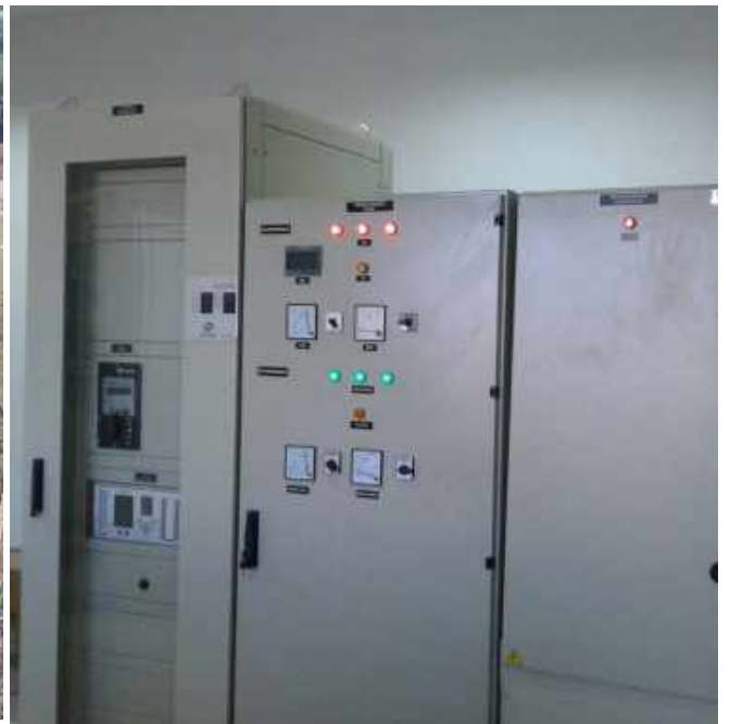
Construcción de la Subestación CURUGUATY 220/23 kV Licitación Pública Nacional ANDE N° 851/2013 - Lote 5 - BONOS I