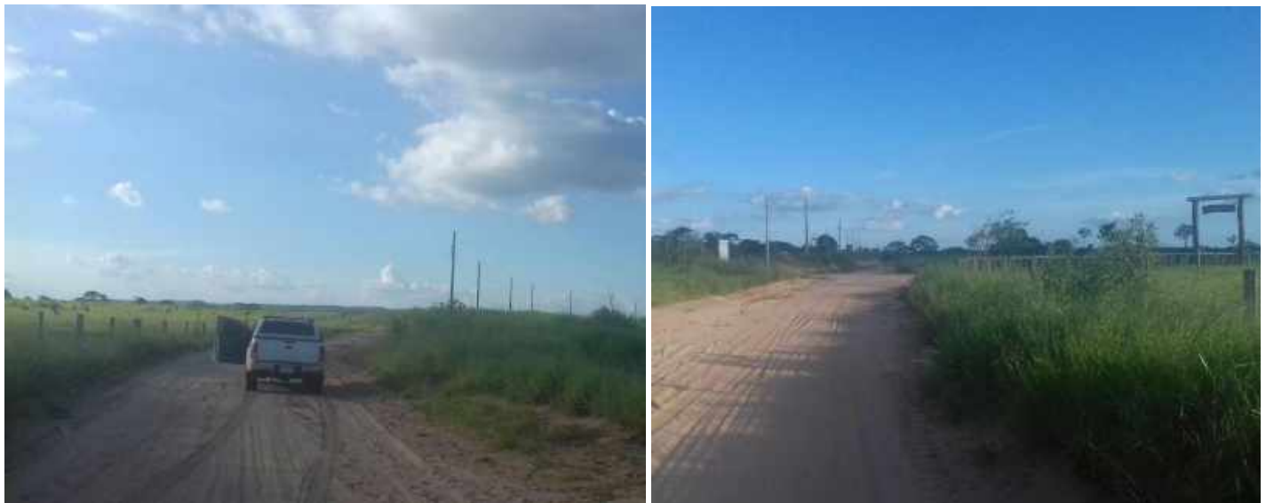
Adecuación de Línea de Media Tensión y Baja Tensión, y Montaje de Puesto de Distribución para Asentamientos de los Distritos de Curuguaty, Ybypyta, Villa Ygatymi, Corpus Cristi (Lote 1). Licitación Pública Nacional ANDE N° 1172/2015