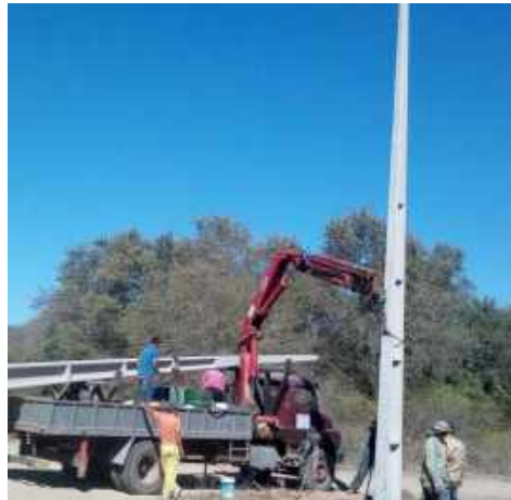
Asentamientos de los Distritos de Curuguaty, Ybypyta, Villa Ygatymi, Corpus Cristi, Villa Hayes y Escobar, Pte Hayes (Lote 2). Licitación Pública Nacional ANDE N° 1172/2015