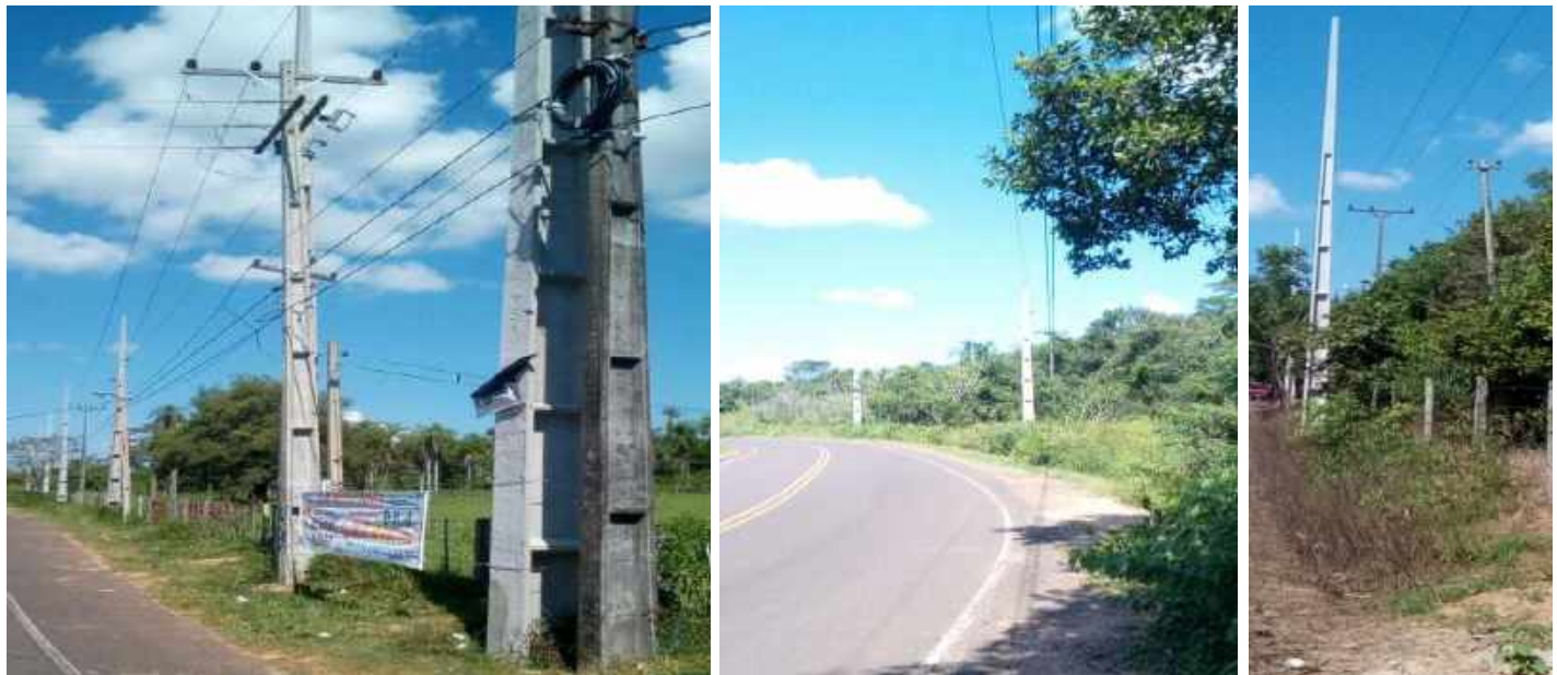
Construcción e interconexión de la Subestación Altos en 220 KV. Construcción de Obras de Distribución, incluyendo el suministro de materiales. Licitación Pública Nacional ANDE N° 1203/2016 - Lote 2 – BONOS II