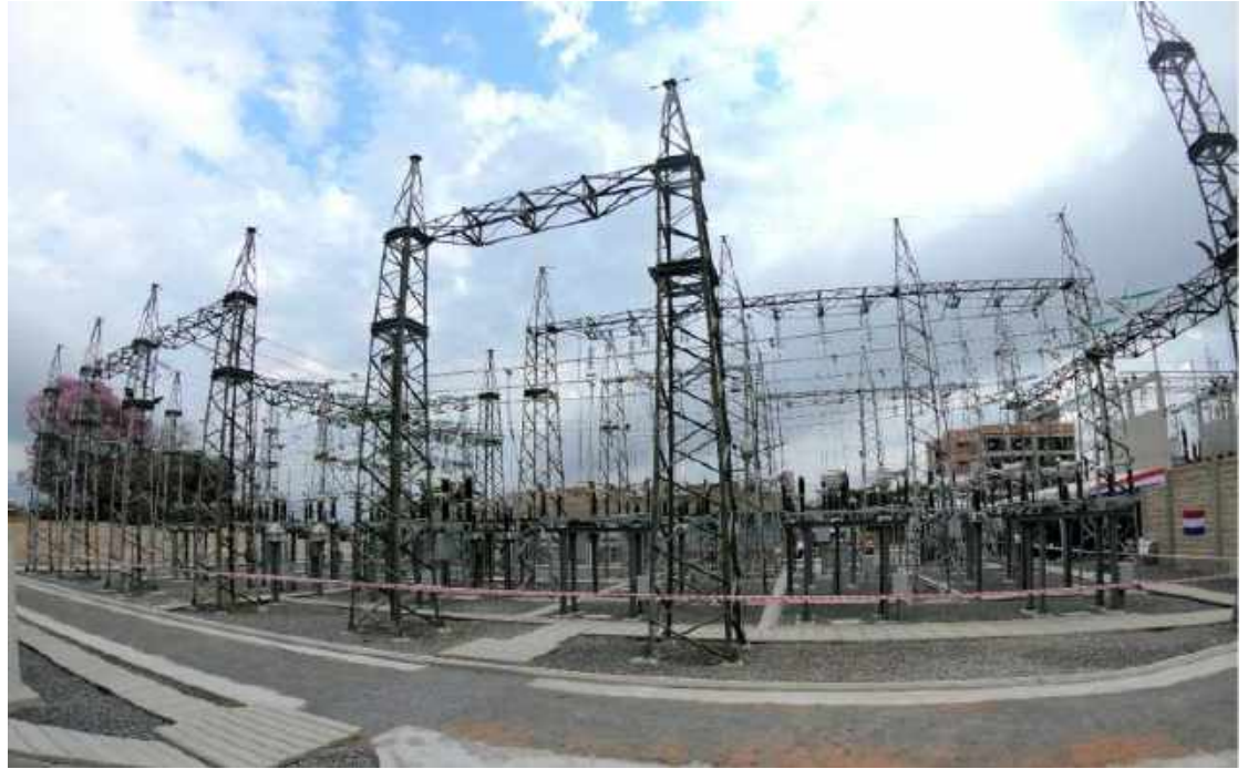
Ampliación de la Subestación LAMBARÉ Licitación Pública Internacional ANDE N° 914/2013 - Lote 5 - BONOS I