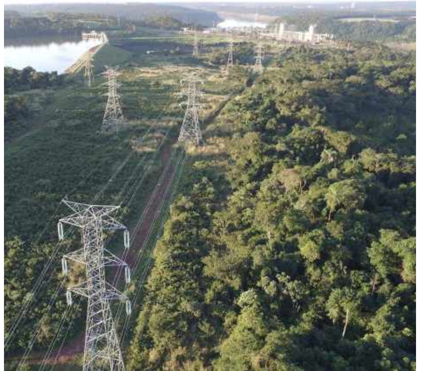
Construcción de la línea de transmisión 2 x 220 kV Acaray - Pte. Franco - Licitación Pública Nacional ANDE N° 1088/2014 - Lote 2 - BONOS II