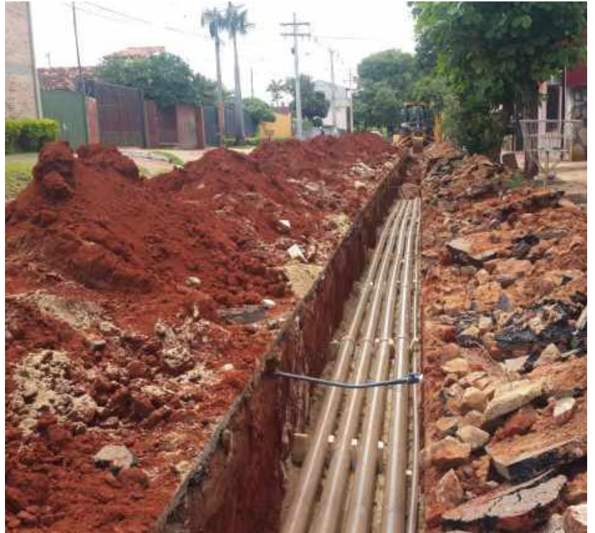
Construcción de LT Subterránea 66 kV - Refuerzo del Sistema Metropolitano – San Lorenzo - Fernando de la Mora, Licitación Pública Nacional ANDE N° 1230/2016 - Lote 1 - BONOS I