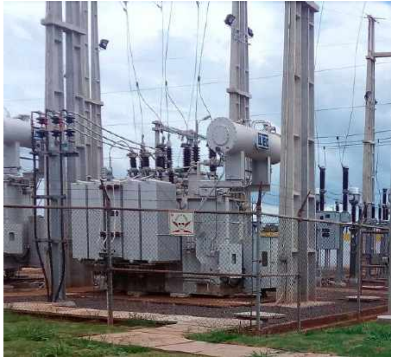
Ampliación de la Subestación PEDRO JUAN CABALLERO Licitación Pública Internacional ANDE N° 914/2013 - Lote 2 - BONOS I