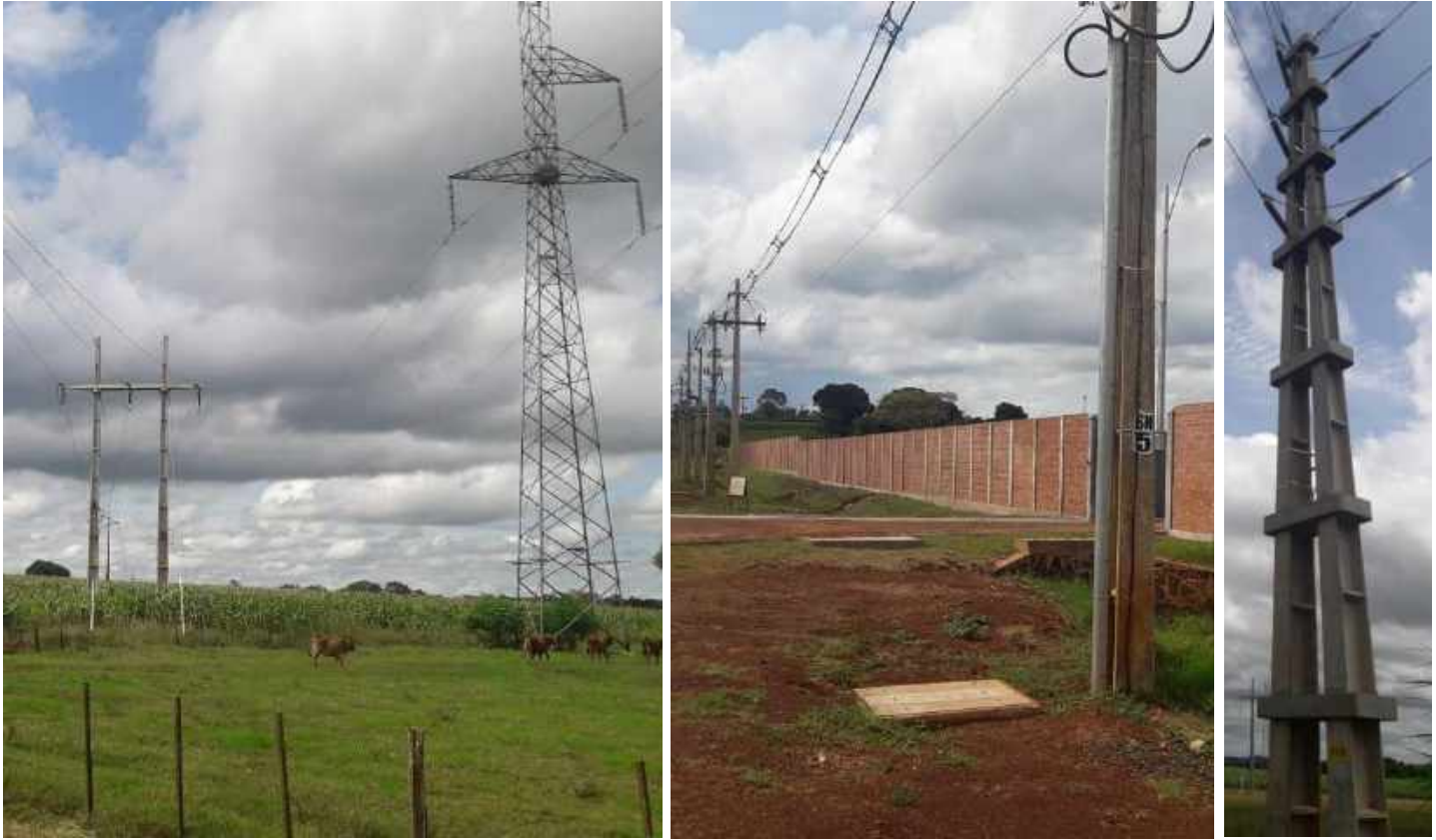
Construcción de Obras de Distribución con provisión total de materiales, Distrito de Fram, Dpto. de Itapúa - Licitación Pública Nacional ANDE N° 1200/2016 – Lotes 2 y 3 – BONOS II