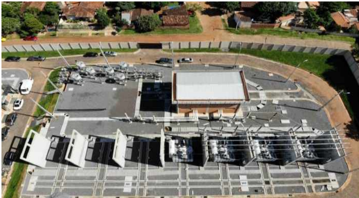
Construcción de la Subestación Barrio Molino en 220/66/23 - Licitación Pública Nacional ANDE N° 1090/2014 - Lote 1 - BONOS II