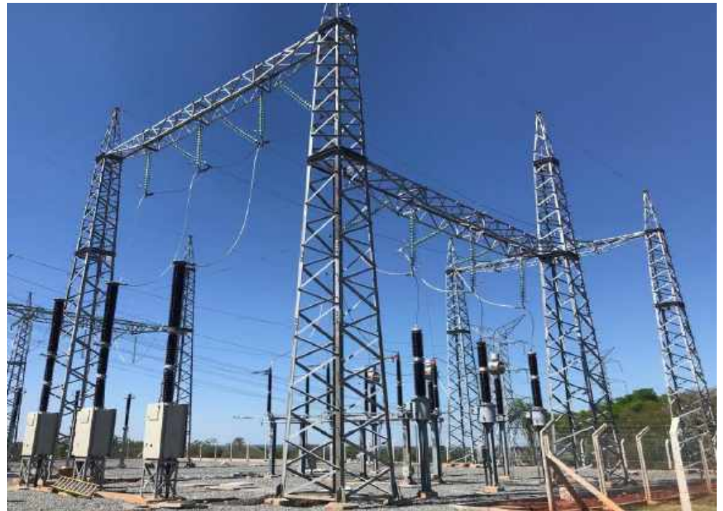
Construcción e Interconexión de la Subestación Altos en 220 kV, Licitación Pública Nacional ANDE N° 1203/2016 - Lote 1 - BONOS II