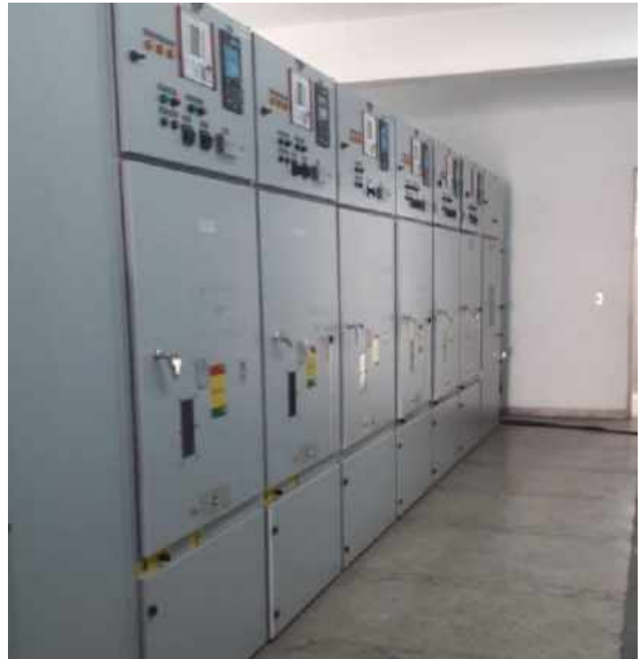
Ampliación de la Subestación GENERAL DIAZ Licitación Pública Internacional ANDE N° 914/2013 - Lote 7 - BONOS I