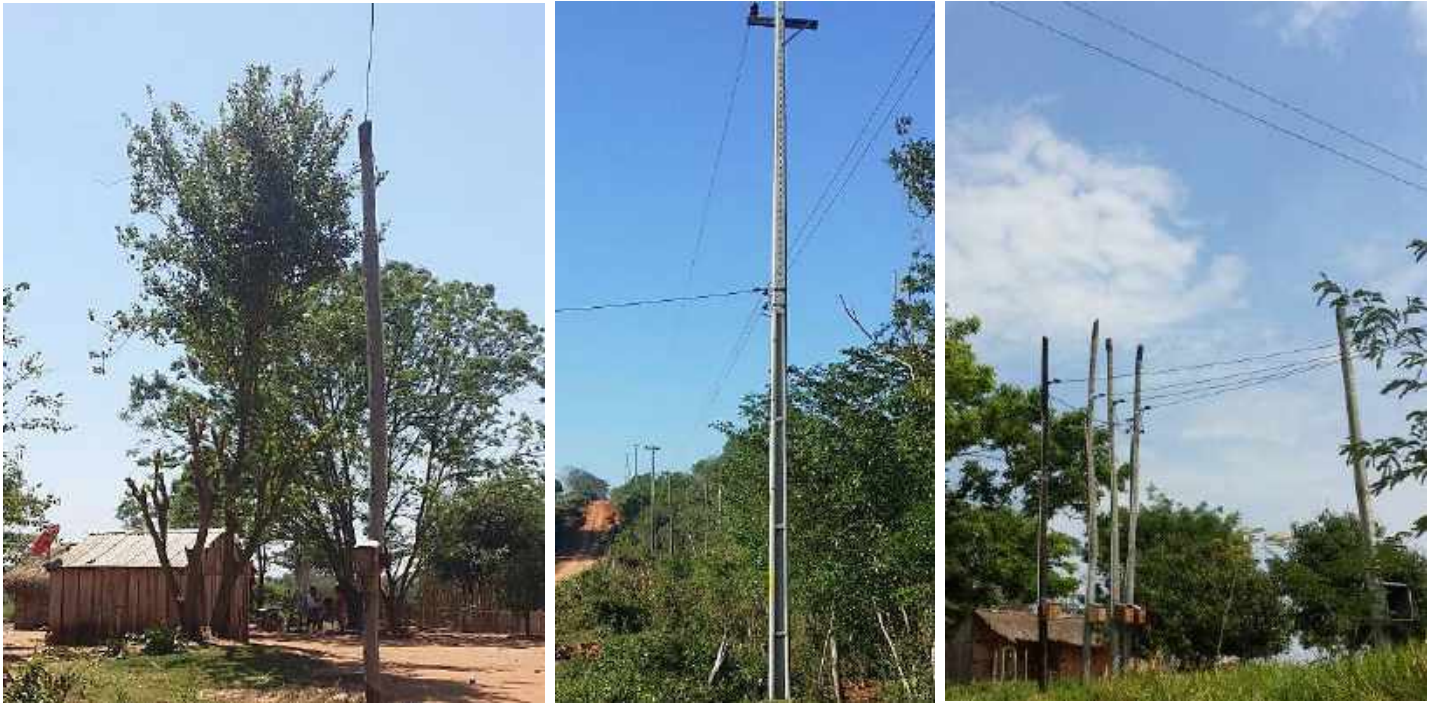
Ejecución de Trabajos de Normalización de Líneas de Autoayuda en MT y BT Canindeyú - Licitación Pública Nacional ANDE N° 1008/2014 - BONOS I