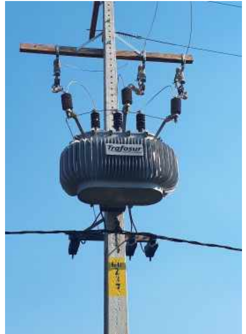
Construcción de Redes de MT, BT y Montaje de PD. Licitación Pública Nacional ANDE N° 1326/2017, Asentamiento San Rafael, Dpto. Central – Lote 4 – BONOS II