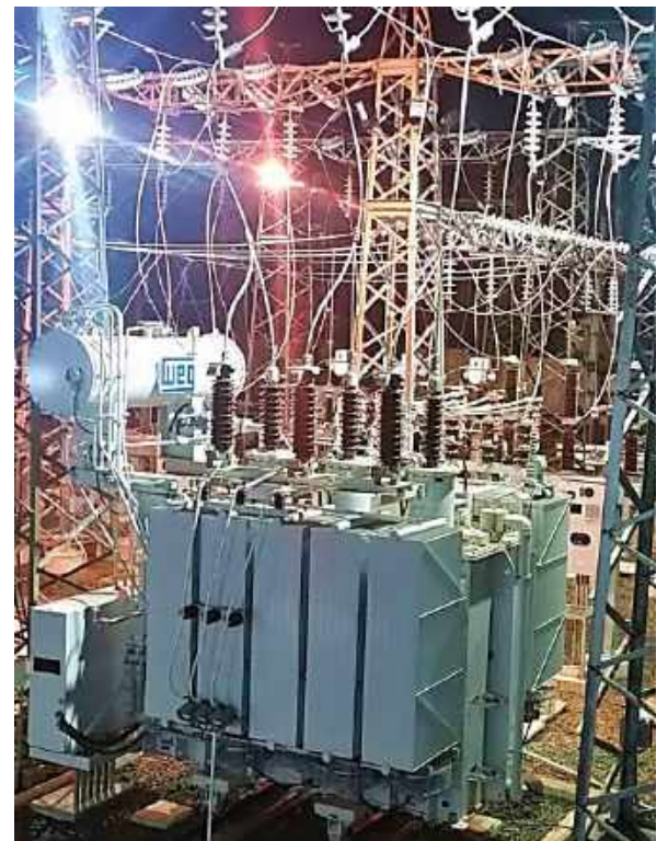
Ampliación de la Subestación HERNANDARIAS Licitación Pública Internacional ANDE N° 914/2013 - Lote 4 - BONOS I