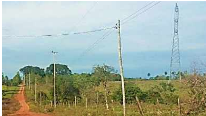
Ejecución de Trabajos de Normalización de Líneas de Autoayuda de BT y MT Licitación Pública Nacional ANDE N° 991/2014 - Lotes 3 y 6 - BONOS I